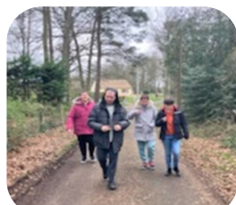
Forêt Saint Clair d'Arcey