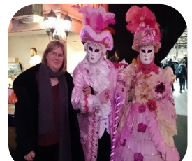
Parc expo Rouen