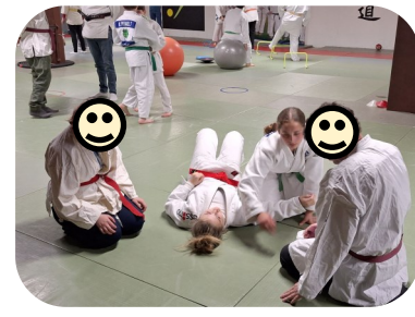
Judo à Caen