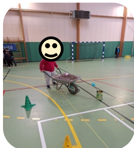
Parcours sportif à Breteuil sur Iton

Plusieurs résidents de la MAS ont participé à différentes manifestations sportives.