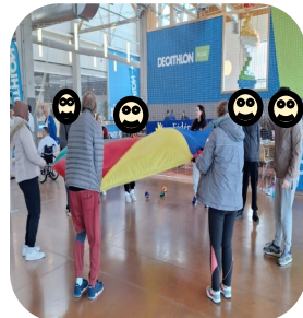
Multisport à Mondeville