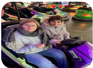
Fête foraine de Pont-Audemer