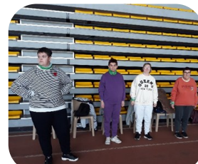
Sport adapté femme Rouen